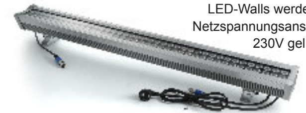
LED-Walls werden mit Netzspannungsanschluß 230V geliefert.